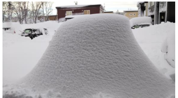
大雪で車が埋もれているのが衝撃的で思わず撮影して友人に送った写真

大阪にいるときは最低気温1℃とかでも寒いと言っていたので、マイナス気温での生活は未知でした。中札内で家を探している時に、貯湯タンクが家の中にあることに驚いたし、「水落とし」という言葉も初めて知りました。また、大阪での暖房器具はこたつや電気カーペットが主流で、ストーブをあまり使ったことがなく、灯油ストーブも初めて使いました。ストーブのつけっぱなしが怖くてできないので、出かけるときはストーブを消して、帰宅してから部屋が暖まるまではダウンを着て過ごしています(笑)