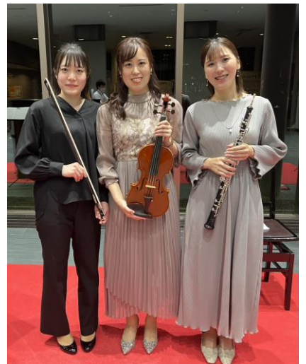
📍 十勝で知り合った方との演奏会

こっちに来てからも、十勝の方々はとても親切にしてくれます。全然知り合いがいなかった所に飛び込んできましたが、知り合いが知り合いを紹介してくれるので、知り合いの輪がどんどん広がっていて、ありがたいです！