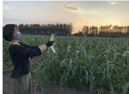
▲アフター5に農家さんのところで旬なスイートコーンを収穫させていただきました

土幌町は農業が基幹の町なので、ここで暮らしているだけで、知らなかった農業や作物の知識について触れることができたり、知り合った農家さんから旬の野菜をいただけるのでとても嬉しく思っています。収穫期にはスイートコーンやアスパラ、ジャガイモなどをたくさんいただけるので、農家さん直伝の美味しい調理法や野菜の保存方法にも詳しくなりました。